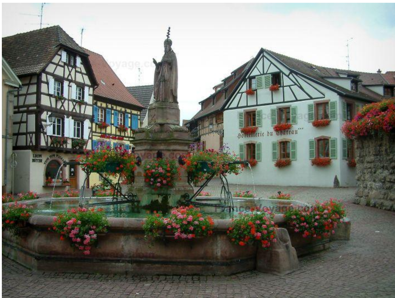
La place d' Eguisheim

Pascal MICHEL nous propose le week-end de l'Ascension 2013 pour nous emmener faire 3 jours de vélo en Alsace.