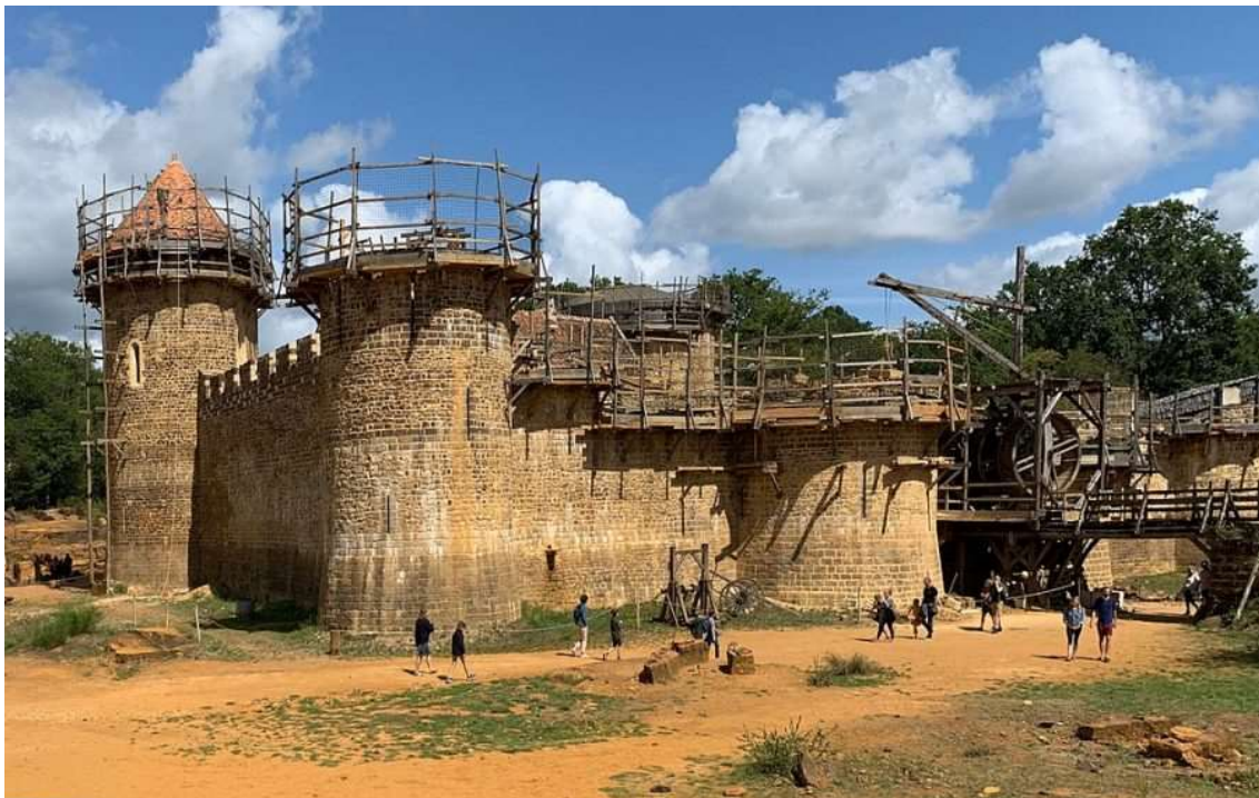
Le château de Guédelon, dans l'Yonne

Pour tous renseignements : JM Drelon tél : 06 07 94 10 61 ou jm.drelon@orange.fr